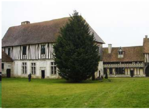
Le manoir vu du Nord