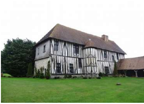
La façade sud du manoir