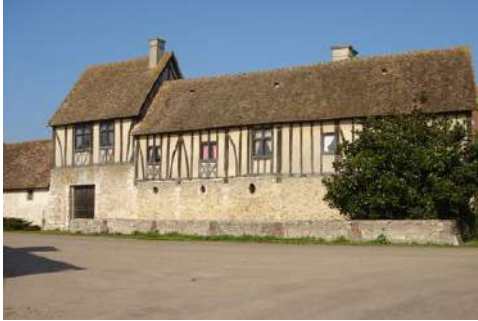
Le bâtiment d'entrée depuis la rue