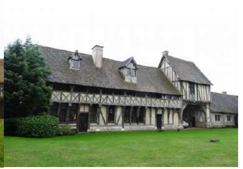
Le bâtiment d'entrée avec sa galerie