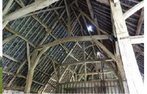
La charpente de la grange

Pour la zone en rose foncé dans le périmètre de 500m