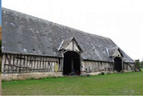
La grange à pans de bois et toiture haute